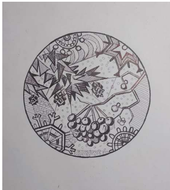
Примеры работ по декоративной композиции