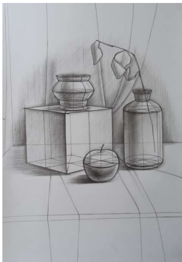
Примеры работ по техническому рисунку «Натюрморт»