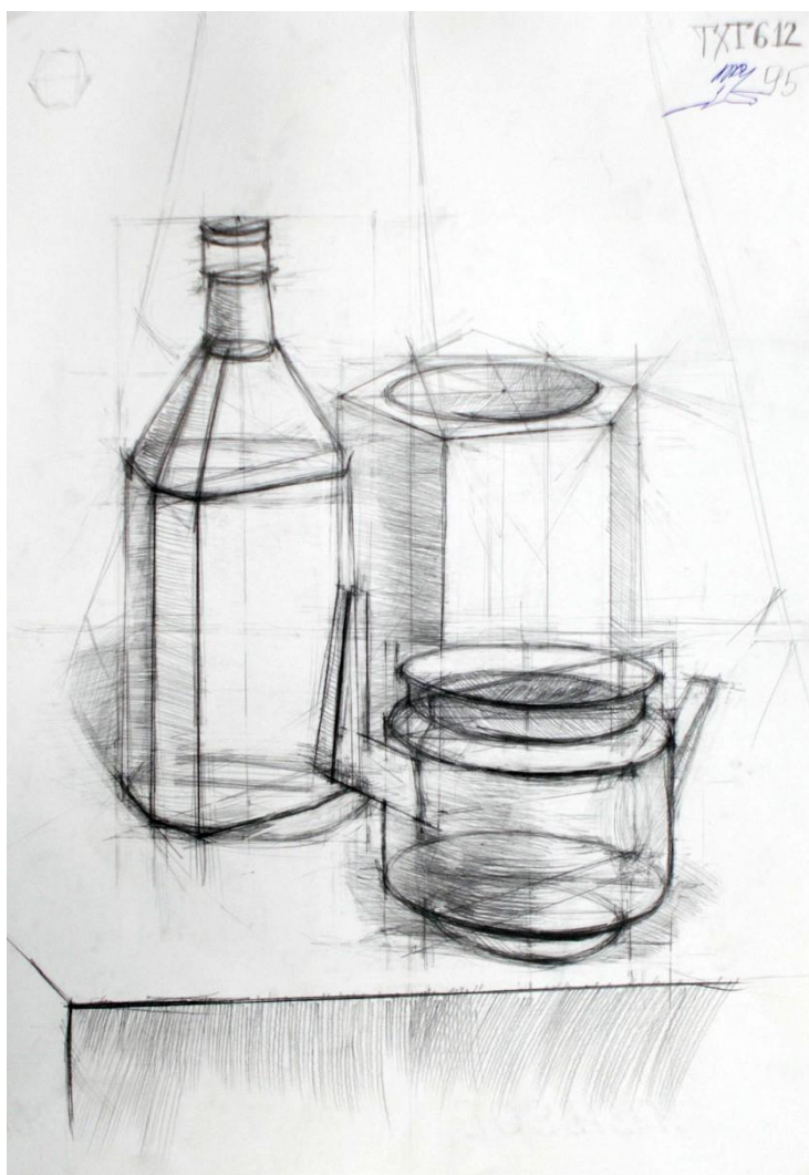
Пример работы по техническому рисунку «Натюрморт»