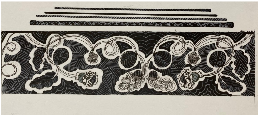
Пример работы по декоративной композиции на тему «Мой лес» с элементами лесной флоры