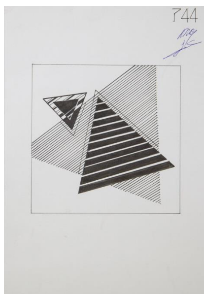
Пример работы по декоративной композиции с элементами контура равносторонних треугольников

В качестве элементов композиции использовать контуры равносторонних треугольников произвольных размеров или контуры квадратов произвольных размеров, толщина линий контуров произвольна. Количество элементов не более трех. Элементы могут пересекаться. Допускается сплошная заливка элементов композиции, а также фигур, образовавшихся в результате их пересечения. Вместо заливки можно использовать различные виды штриховки.