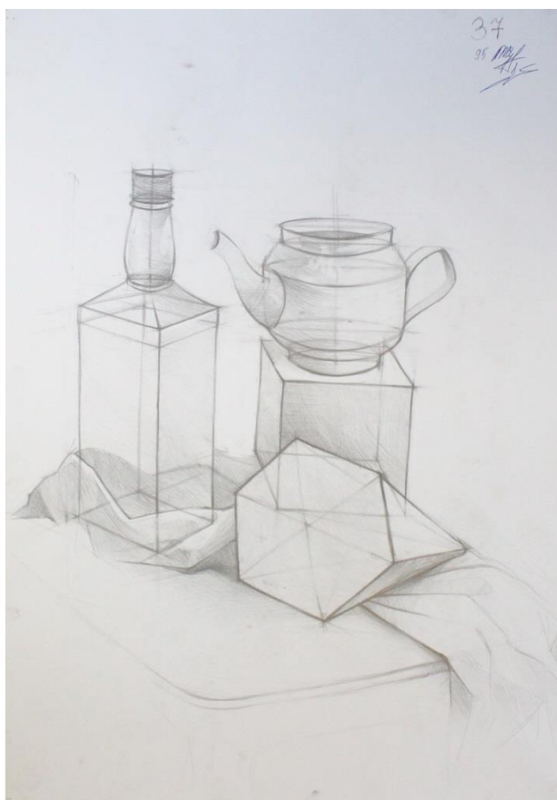
Пример работы по техническому рисунку «Натюрморт»