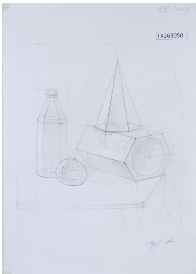
Пример работы по техническому рисунку «Натюрморт»