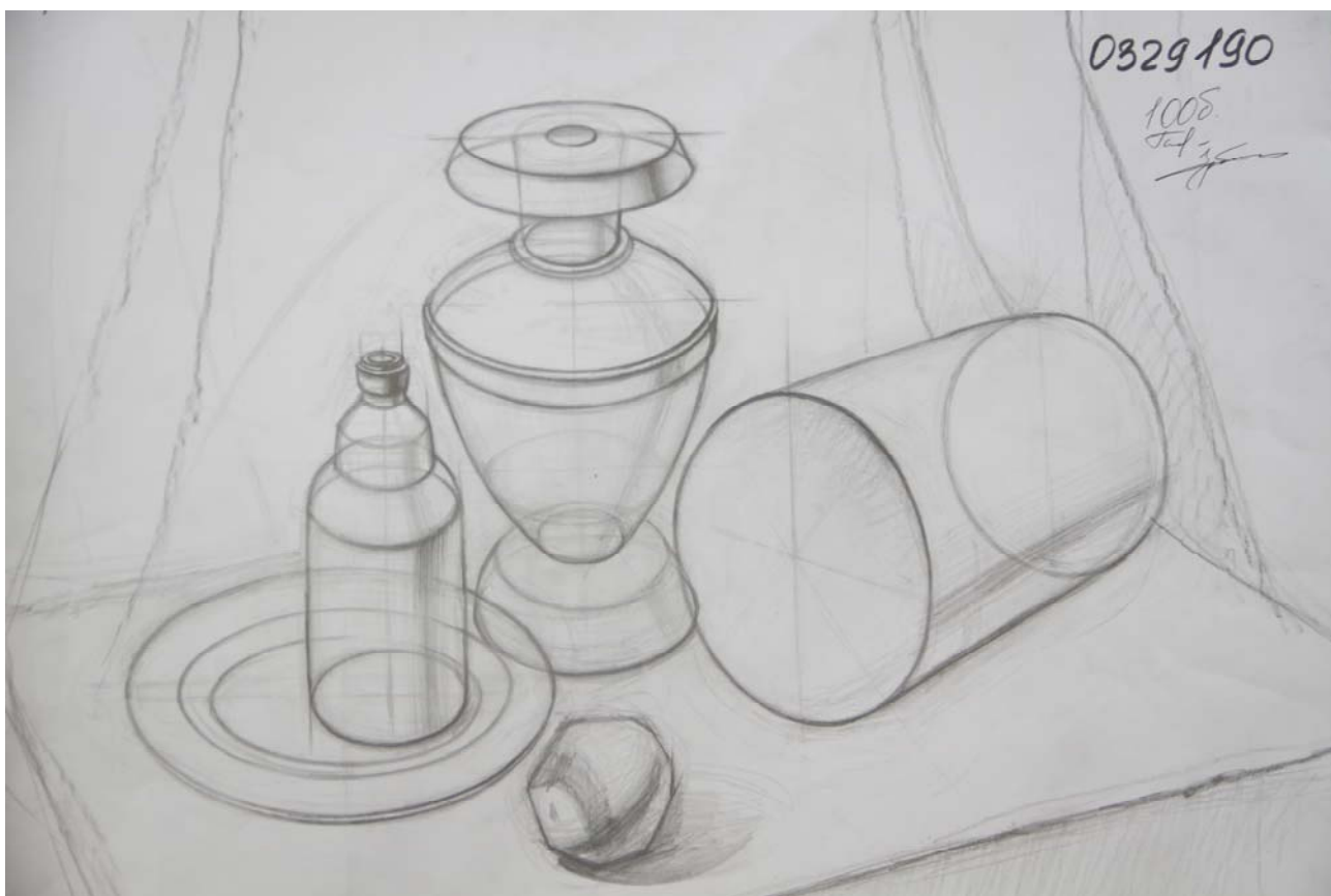
Пример работы «Рисунок»

Техника исполнения – графитный карандаш. Формат А-2.