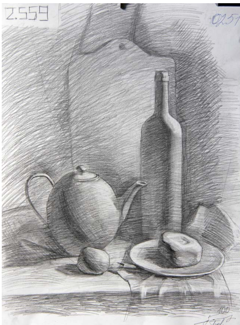
Пример работы «Рисунок»

Техника исполнения – графитный карандаш. Формат А-2.