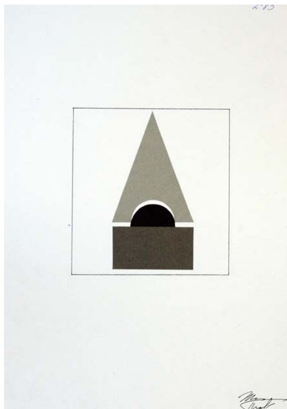
Пример работы «композиция «Статика»