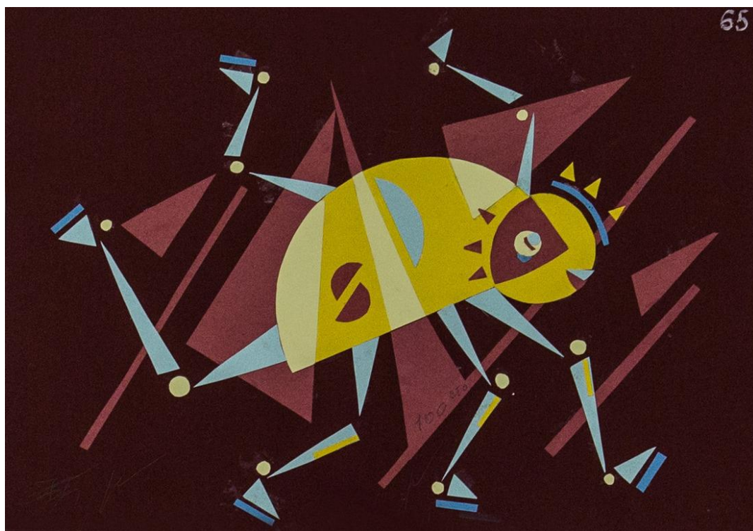
Пример работы по композиции «Плоскостная хроматическая композиция»