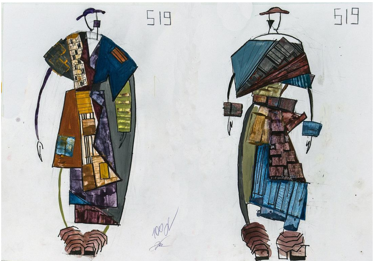
Пример работы по композиции «Эскиз костюма»