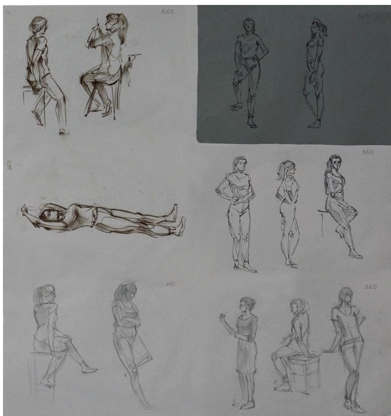
Пример работы по академическому рисунку «Рисунок фигуры человека»