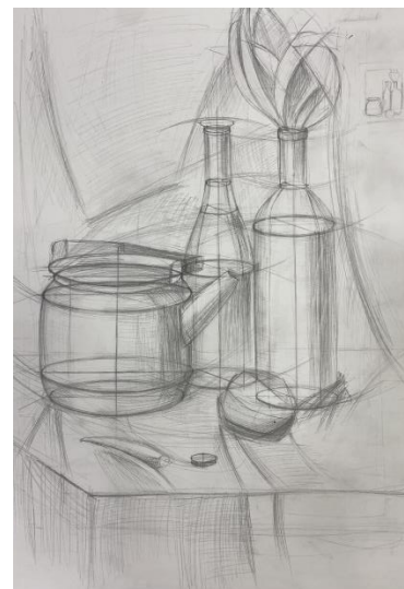
Примеры работ по творческому конкурсу «Технический рисунок»