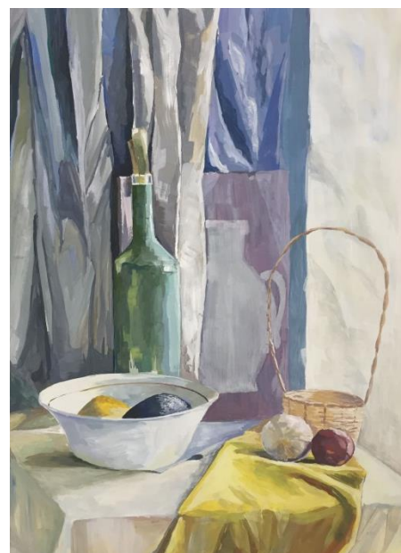
Примеры работ по творческому комплексу «Живопись»