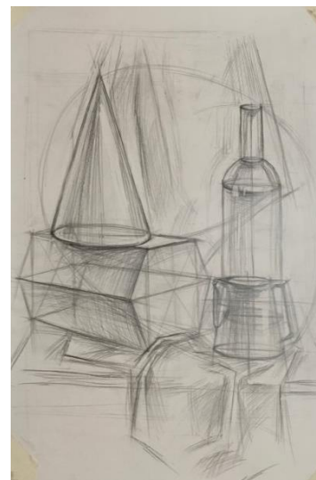
Примеры работ по творческому конкурсу «Академический рисунок»