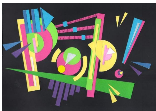
Примеры работ по творческому комплексу «Композиция»